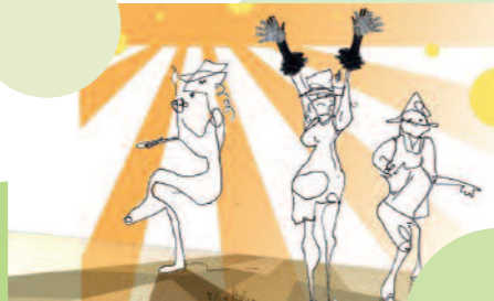
Zeichnung: Kerstin Unger