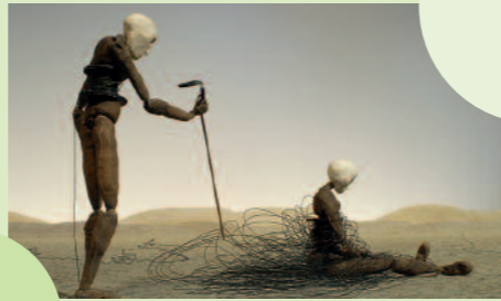
Moirai / Film / 10 min / Kerstin Unger

Beim Animationsworkshop mit der prämierten Filmemacherin Kerstin Unger kannst du deinen ganz eigenen Film (er-)finden. Die einzige Vorgabe ist, dass es um eine Auseinandersetzung mit der Thematik Heimat und Fremde gehen soll: du kannst untersuchen, in