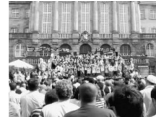
SPOT 18 Wo warst du am 6. Mai 2006? Where were you on May 6, 2006? Deutschland 2017, 2'27"

Eine junge Frau beschreibt ihre Reaktion auf den rassistischen Brandanschlag in Mölln Anfang der 90er. A young woman describes her reaction to the arson attack in Mölln in the early 90ies.