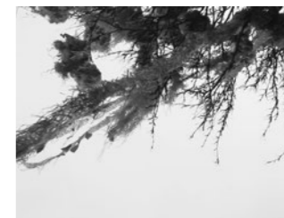
SPOT 21 Wieviel Staat ist in der Naziszene? How much state is in the Nazi scene? Deutschland 2017, 2'52"

Am Tag nach dem Anschlag in der Keupstraße schloss Innenminister Schily einen rechtsterroristischen Hintergrund aus. Only one day after the 2004 attack in Cologne, interior minister Otto Schily told the press that »a terroristic background can be excluded.«