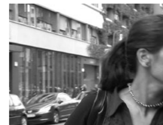
SPOT 20 Wie wird man zu einer Deutschen? How to become German? Deutschland 2008/2017, 1'08"

Hört wie ein Stethoskop Tatorte des NSU in Nürnberg auf ihren Nachhall ab. Examining the echoes of crime scenes like a stethoscope.