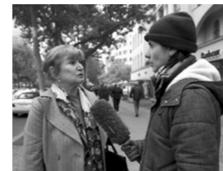
SPOT 2 Was würden Nazis niemals tun? What would Nazis never do? Deutschland 2017, 2'36"

Geschichtenerzählen als Widerstand gegen die Wahrnehmung, dass das Leben eine Reihe zufälliger Ereignisse ist. Storytelling as resistance against the perception that life is a series of random events.