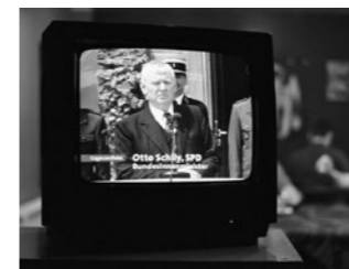
SPOT 9 Konkrete Spuren fehlen? Concrete evidence is missing? Deutschland 2017, 2'22"

»Ich fühle mich eigentlich auch nicht mehr türkisch, aber ich muss mich türkisch fühlen ...« »I don't feel like I'm Turkish anymore, actually, but I have to ...«