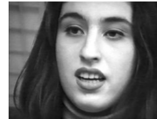
SPOT 3 Weil ich nun mal hier lebe. Because I live here. Deutschland 1994/2017, 56"

Verschleppte Putzfrau, verschleppte Tochter, bedrohte Freundin eines Deutschen: rassistische Stereotype im deutschen Fernsehen. Abducted cleaning lady, abducted daughter or threatened girlfriend of a German man: On racist stereotypes in German TV.