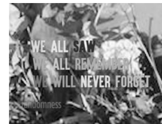
SPOT 11 (Gegen) die Willkür ... (Against) Randomness ... Niederlande 2017, 2'14"

Erinnerungen an den Nagelbombenanschlag in der Keupstraße in Köln. Conjuring up memories of the nail bomb attack at the Keupstraße in Cologne.